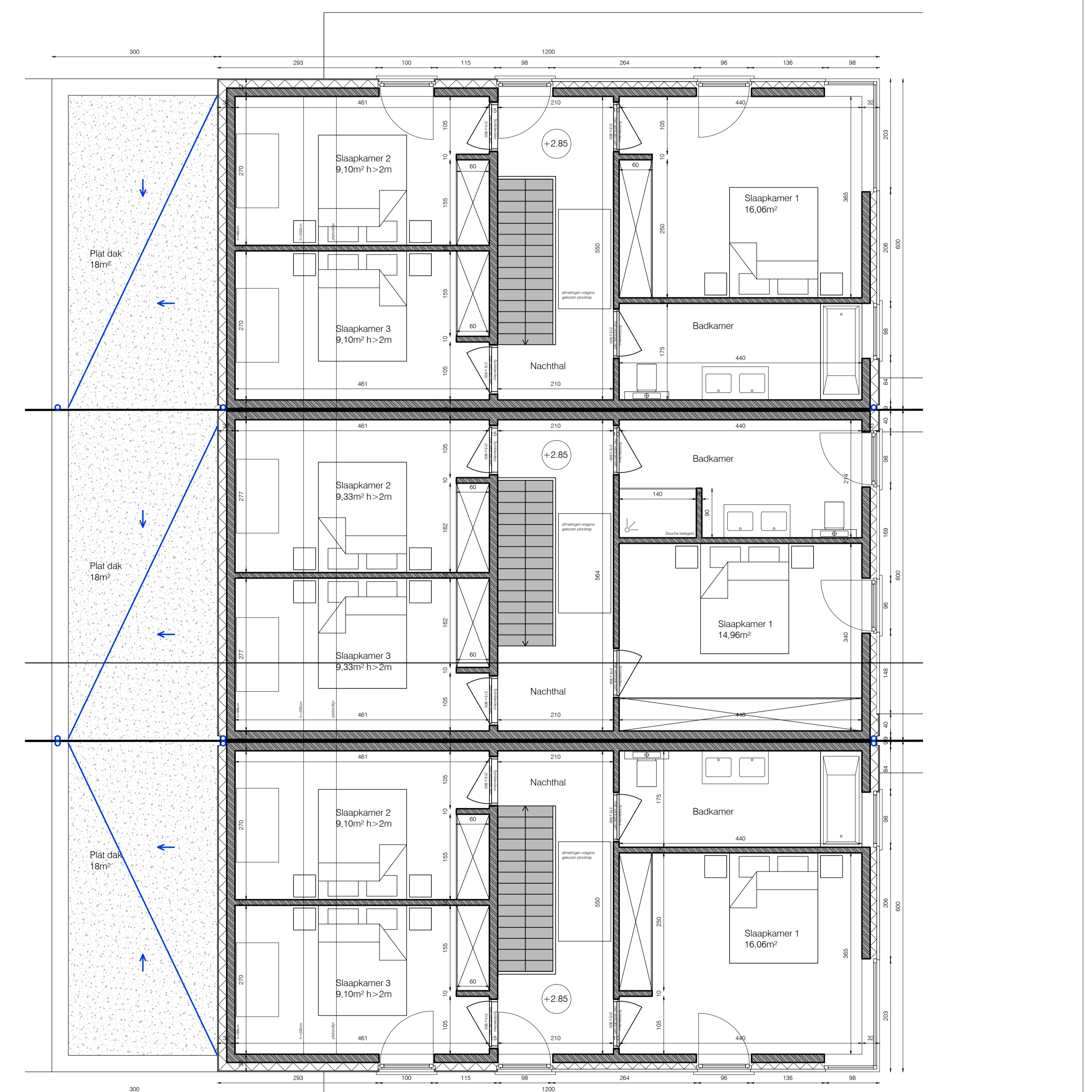
1STE VERDIEPING 1/50