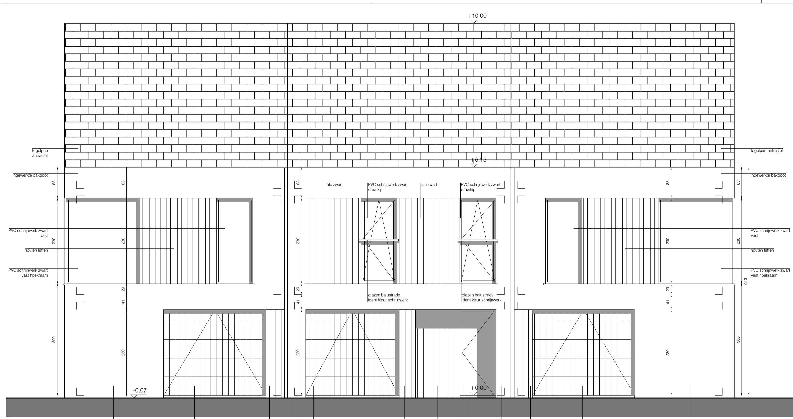
VOORGEVEL 1/50 RECHTER ZIJGEVEL 1/50