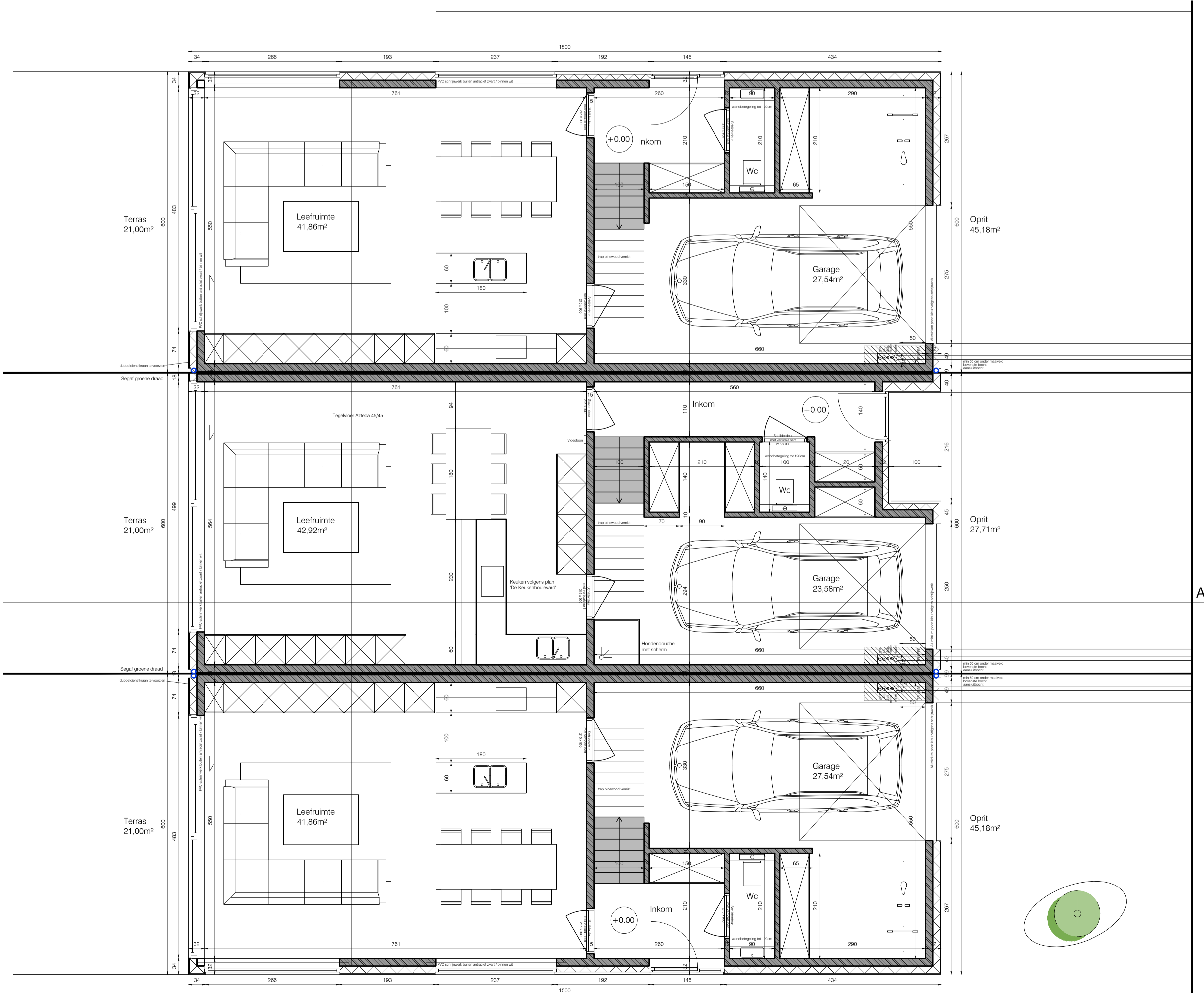
GELIJKVLOERSE VERDIEPING 1/50